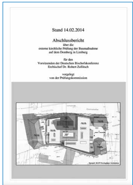
Abb. 1–3: Berichterstattung der „Bild“-Zeitung (11.10.2013) und des „Spiegel“ (14.10.2013); Abschlussbericht der Deutschen Bischofskonferenz zu den Baumaßnahmen in Limburg